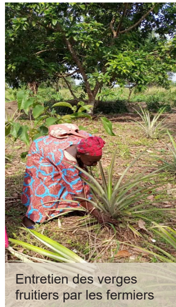
Entretien des verges fruitiers par les fermiers

En dépit des efforts déployés et des acquis obtenus à la clôture de cette première phase, la mise en œuvre du PIREDD, qui reste pertinente, a été perturbée par des difficultés d'ordre technique et de gouvernance surtout au cours de l'année 2021 ; Cela a eu un impact négatif sur sa performance jugée moyenne à la fin de la première phase du PIREDD par rapport aux résultats attendus.