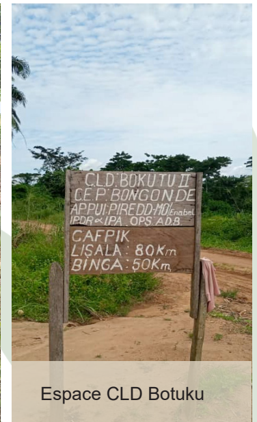
Espace CLD Botoku