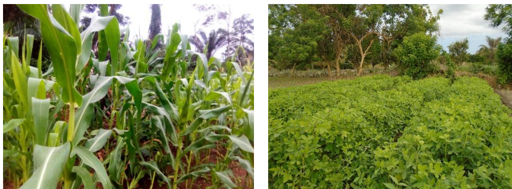
Parcelles de maintenance variétale de maïs et arachide

Ces parcelles de maintenance ont permis d'obtenir des semences souches qui permettront au secteur privé de lancer la campagne suivante le programme de maintenance des espèces concernées : maïs (500 épis), riz (500 panicules) et arachide (200 lignées).