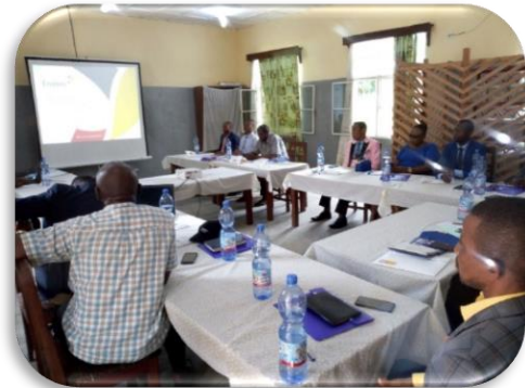
Figure2 : Photo de sensibilisation avec les membres du gouvernement