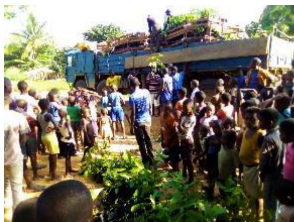
Figure 2 : Distribution de plantules auprès des bénéficiaires