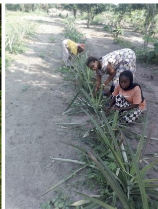
Bananiers plantain, Maraichère et ananas en prévision de la réduction de la pression sur la forêt

Constat encourageant sur l'agroforesterie : de manière tout à fait fortuite, l'équipe du PIREDD_MO en mission dans le territoire de Lisala a découvert le champ d'un ménage exploité sous le système agroforestier. Cette « découverte » a encouragé l'équipe qui venait de former les fruiticulteurs en agroforesterie fruitière. Ce qui augure de bons résultats en termes d'adoption de ce système agroforestier.