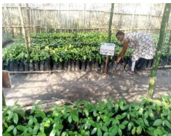
Figure 1 : Pépinière d'espèce fruitière et pérenne