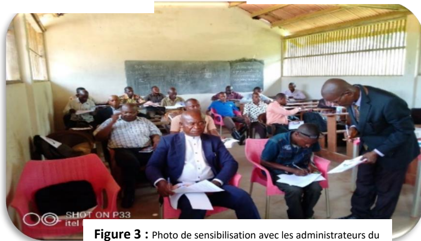
Figure 3 : Photo de sensibilisation avec les administrateurs du territoire et STD de Lisala

Après avoir lu quelque article des lois ci-dessous, tous les participants ont fait une demande verbale celle d'avoir lesdites lois en endure :