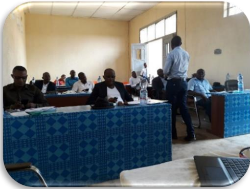
Figure 1 : Photo de sensibilisation avec les élus Provinciaux