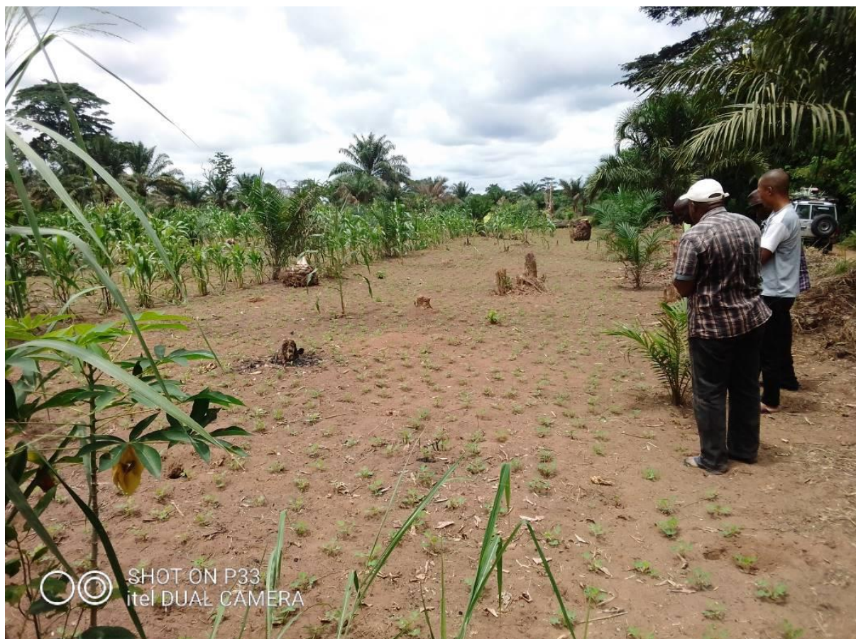
Champ d'un paysan sur la route entre BINGA et MONDONGO. On y voit une agroforesterie (agriculture en couloir) telle que prônée par le PIREDD_MO