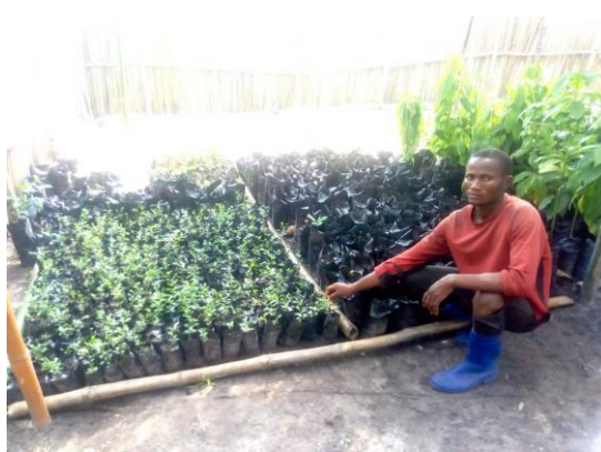
Production de plantules dans la pépinière primaire d'Ekange