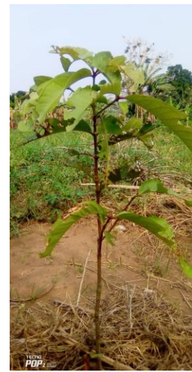
Taille de quelques plantules dans les vergers fruitier du territoire de Lisala (décembre 2020)